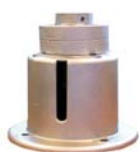
F28 CODE 1543 ФЛАНЕЦ СОЕДИНИТЕЛЬНЫЙ F13